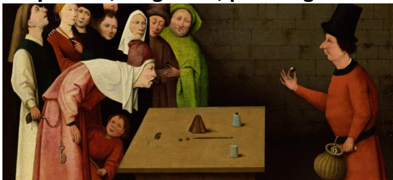
Jérôme Bosch, « L'Escamoteur » (v. 1475-1505) Saint-Germain-en-Laye

Au XVIII e siècle, l'on se passionne pour toutes les sciences; on s'interroge alors en particulier sur le « merveilleux » qu'elles peuvent véhiculer – pensons aux automates ou à des disciplines comme la mécanique, l'optique aussi. La magie, qui tout au long du Moyen Âge constituait une discipline (« art ») à part entière, passablement ambiguë il est vrai, fait alors l'objet d'une attention particulière. C'est le XVIII e siècle qui tranche en effet le débat en faisant désormais de la magie une expression artistique et un divertissement. La pratique de l'illusion devient ainsi un divertissement, un spectacle apprécié par toutes les couches de la société, du petit peuple jusqu'aux têtes couronnées. De grandes figures de cet art apparaissent, à l'instar de Giuseppe Pinetti (1750-1805), et qui donnent corps à cette nouvelle réalité. La naissance d'un mot (et d'un métier) entérine cette passionnante évolution : le prestidigitateur.