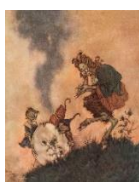
Hans Christian Andersen, La Reine des Neiges, ill. Edmond Dulac PREMIERE HISTOIRE QUI TRAITE DU MIROIR ET DE SES MORCEAUX